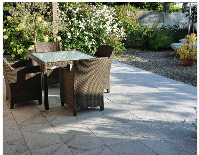
Sitzplatz mit Natursteinplatten