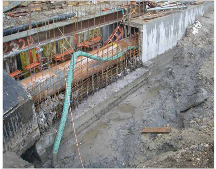
Abwasserkanal in Ortsbeton