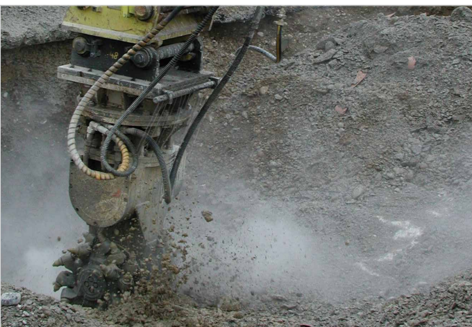
Panzersperre – Betonabbau mit Fräse