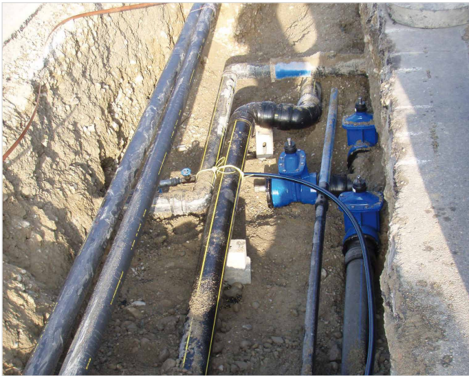
Leitungen für alle Medien