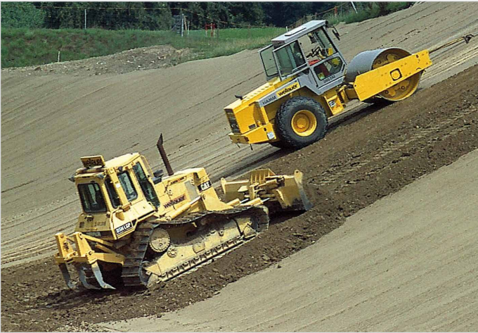
Einbau der Abdichtung Deponie Emmerig